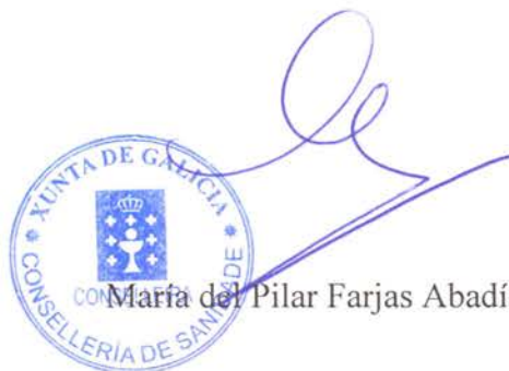
María del Pilar Farjas Abadía