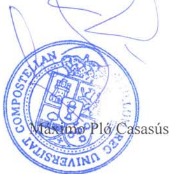
Maximo Pló Casasús

O Reitor PD RR de 31 de xullo de 2007 (DOG de 19-09-07) O Vicerreitor de Oferta Docente e Espazo Europeo de Educación Superior