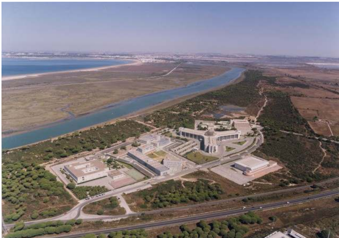
Figura 7.1.- Vista general del Campus del Polígono Río San Pedro en Puerto Real (norte hacia arriba) en la que se observan algunos de los valores ambientales del Parque Natural Bahía de Cádiz: cordones dunares, marismas y zonas endorreicas. (Fuente: UCA).

La Facultad de Ciencias del Mar y Ambientales, solicitante del título, se encuentra en el Campus de Puerto Real. Dicho Campus se sitúa en un entorno natural privilegiado, en pleno contacto con el Parque Natural de la Bahía de Cádiz (Fig. 7.1) y en el centro geográfico de los municipios que constituyen la Mancomunidad de la Bahía de Cádiz, con núcleos muy importantes de población en un radio de 20 Km., incluyendo Cádiz, Jerez, San Fernando, Chiclana, el Puerto de Santa María y el municipio de Puerto Real. En su conjunto suman una población de más de 600.000 habitantes.