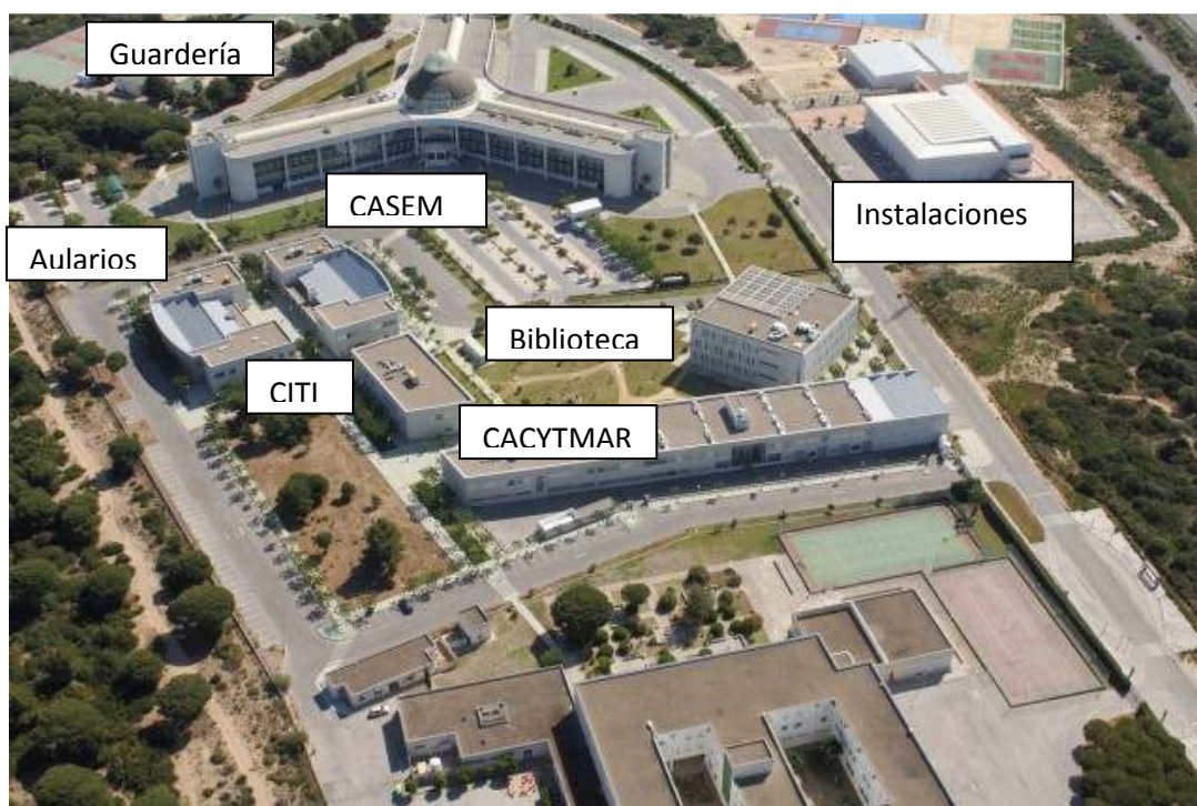
Figura 7.2.- Vista general del Campus dónde se aprecia el edificio principal (CASEM), el Centro Integrado de Tecnologías de la Información (CITI), la biblioteca, los aularios y el Centro Andaluz de Ciencia y Tecnologías Marinas (CACYTMAR: centro de investigación mixto UCA-Junta de Andalucía). (Fuente: UCA).

En cuanto a los servicios de tipo social que existen en este Campus se encuentran la guardería y un amplio servicio de instalaciones deportivas: piscina cubierta, gimnasios y diversas canchas deportivas tanto cubiertas como al aire libre (Fig.7.2).